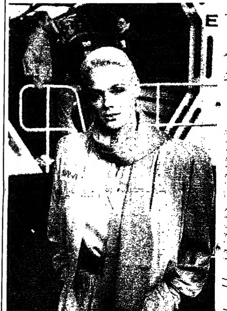
الملكة بريجيت تلسون (الزوجة السابقة للممثل الأميركي سلفستر ستالوني)، أثناء تمثيلها في آخر فيلم لها، جريمة في ضوء القمر، بريجيت تقوم بدور مفضش اميركي ترسله نازا، وكالة الفضاء الأميركية) إلى القمر من أجل تسوية مشكل معين، فتقع هناك في حب نظيرها السوفياتي ويحلان المشكل معا.